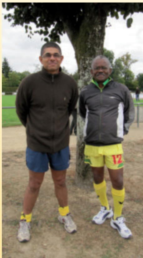
Les rencontres intergénérationnelles ont suscité l'enthousiasme avec plus de 100 participants de tous âges.