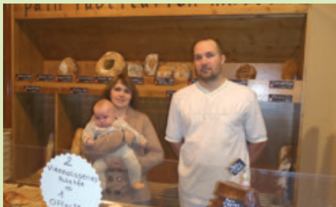
Les nouveaux boulangers et heureux parents de la place Ferdinand de Béost.

Place Ferdinand de Béost, deux commerçants viennent de rejoindre la commune.