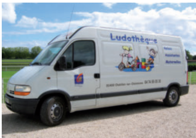
La ludothèque Brin d'Malice s'invite au centre de loisirs.

Jeux de société, de construction, d'imitation..., il y en a pour tous les goûts.